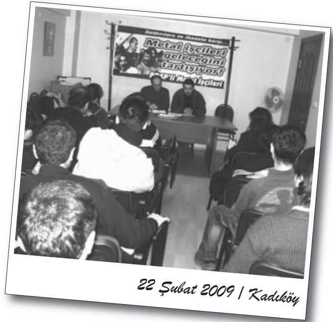
22 Şubat 2009 | Kadıköy

5- Tek tek kapitalistlere karşı verilecek mücadelenin kapitalistler sınıfına yöneltilmesi ve sınıfı kesen ortak talepler doğrultusunda bir mücadelenin örgütlenmesi.