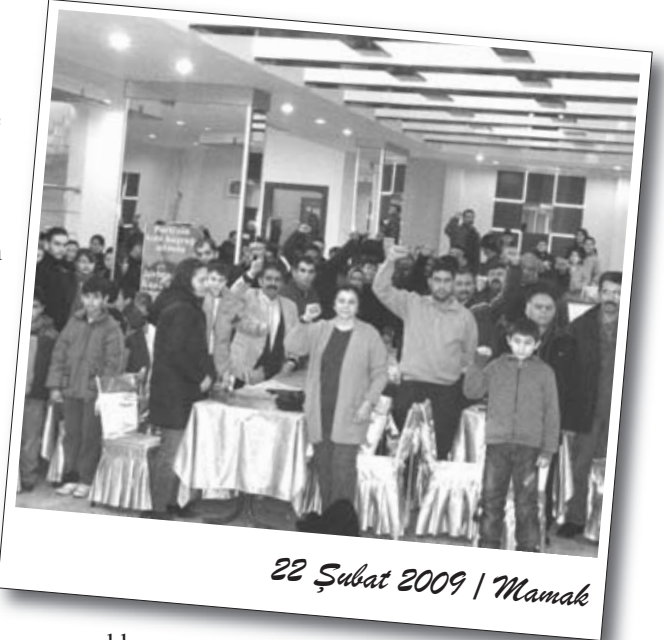
22 Şubat 2009 / Mamak

Coşkulu geçen etkinlik Mamak İşçi Kültür Evi Çocuk Tiyatrosu'nun 14 kişilik ekiple sergilediği “En güçlü kim!” isimli oyunla devam etti. Bir AÜ